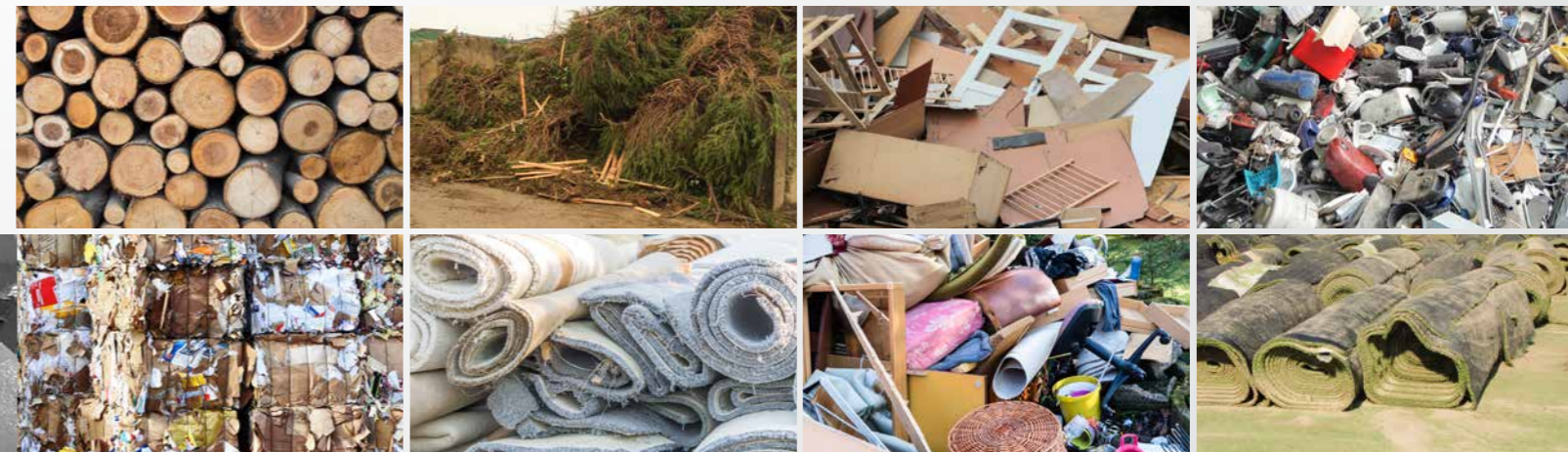
Unité de broyage : multi-fonction